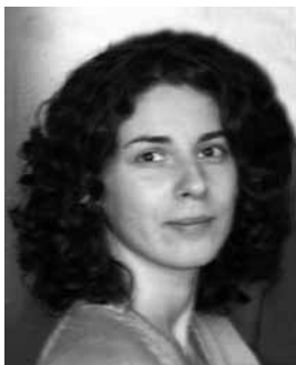
Piše: Mirjam Trebše